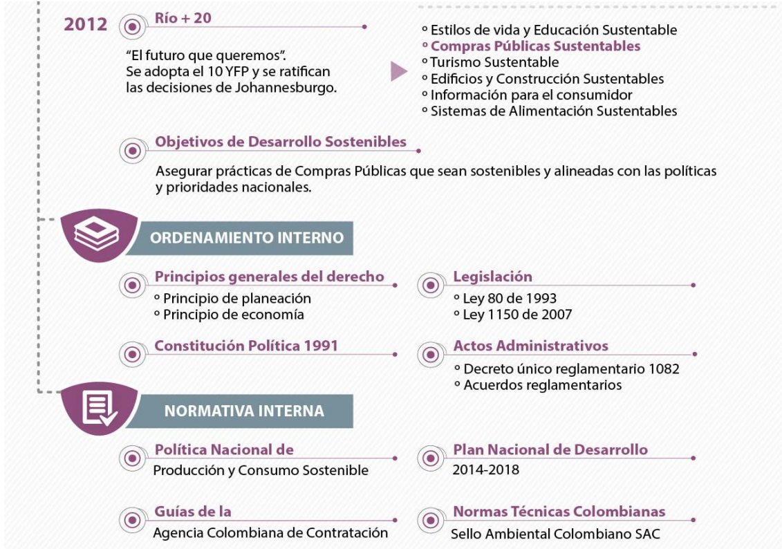
Figura 2. Avances Normativos en Compras Públicas Sostenibles