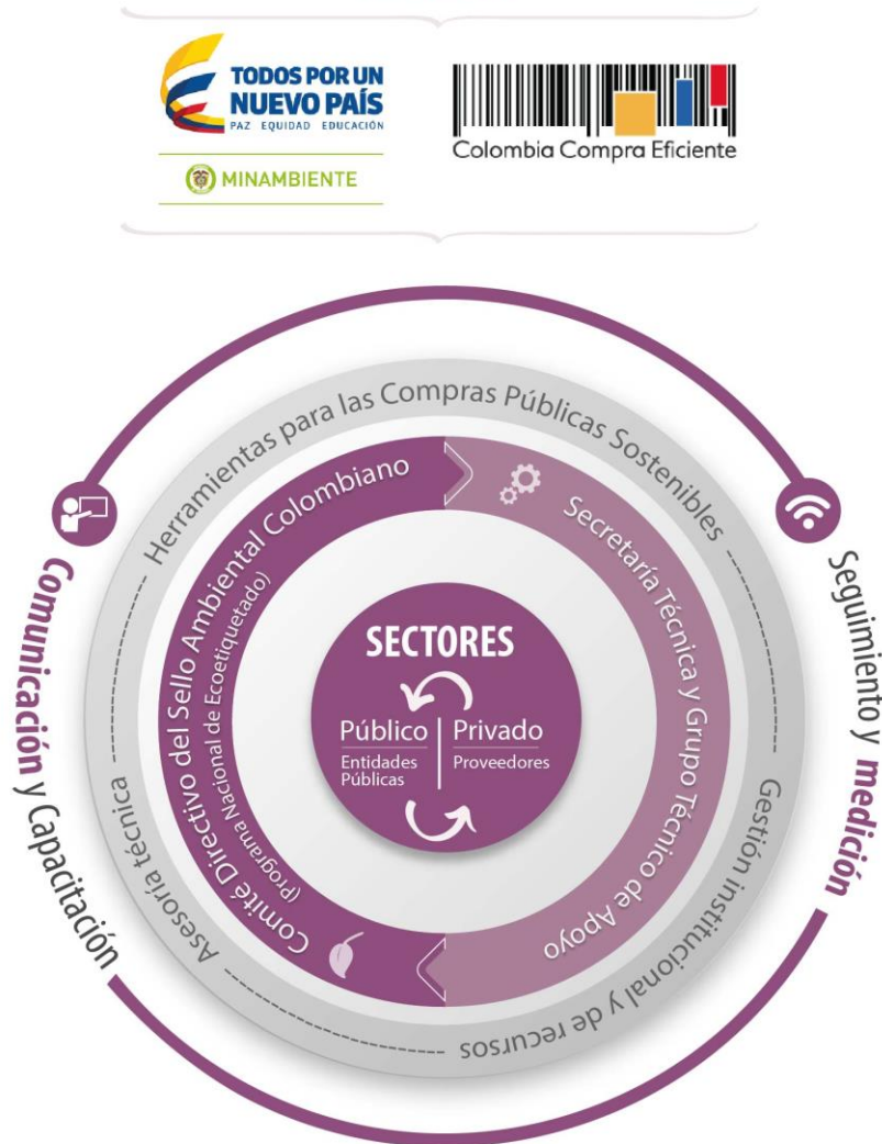
Figura 4. Figura. Estructura del Plan Nacional de Compras Públicas Sostenibles y Ecoetiquetado y Ejes de actuación