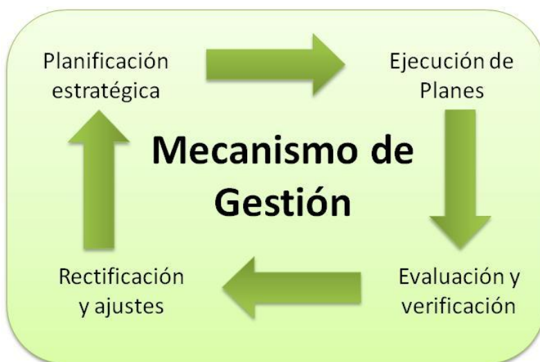
Figura 3: Mecanismo de Gestión

El proceso de gestión que se sugiere usar para la implementación de este plan es un modelo basado en el “Círculo de Deming” (de Edward Deming). Este modelo funciona a través de cuatro etapas o procesos sucesivos y cíclicos: planificación estratégica; ejecución de actividades; evaluación y verificación; y, rectificación y ajustes.