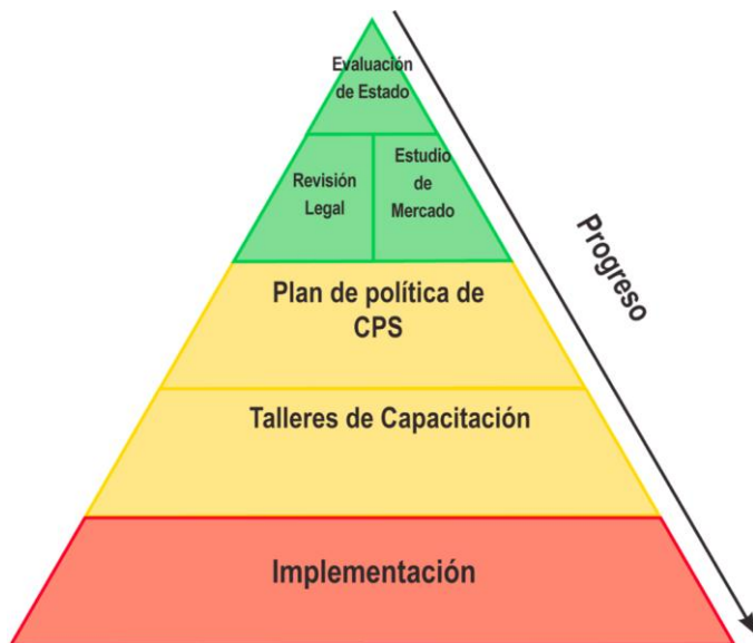
Figura 1: Metodología de implementación

El plan ha partido de lo desarrollado en las etapas anteriores y pretende aunar todos los esfuerzos del Estado que tengan la intención de incorporar las compras sustentables a sus procesos de contratación durante el periodo 2012-2016. En la actualidad ya existen esfuerzos aislados de algunas instituciones que han iniciado la incorporación de criterios ambientales a sus contrataciones pero de una forma aislada y con bajos niveles de monitoreo y seguimiento.