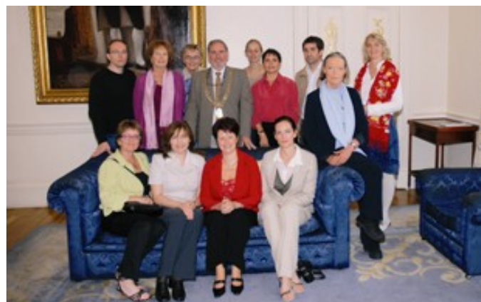
Medlemmer fra CCN Task Group 8 møter Dublins ordfører for å diskutere Utdanning for Bærekraftig Utvikling

Utdanning for Bærekraftig Utvikling-seminarene som Task Group medlemmer har utført har lagt vekt på bruken av eksperimentell metode som nærmere stimulerer til undervisning for bærekraftig utvikling enn til undervisning om bærekraftig utvikling. Med andre ord er aktiv undervisning og læringsmåter (transformative eller omformende metoder) anvendt og ikke formel eller tradisjonell innfallsvinkler til undervisning og læring (transmissive eller overførende metoder)