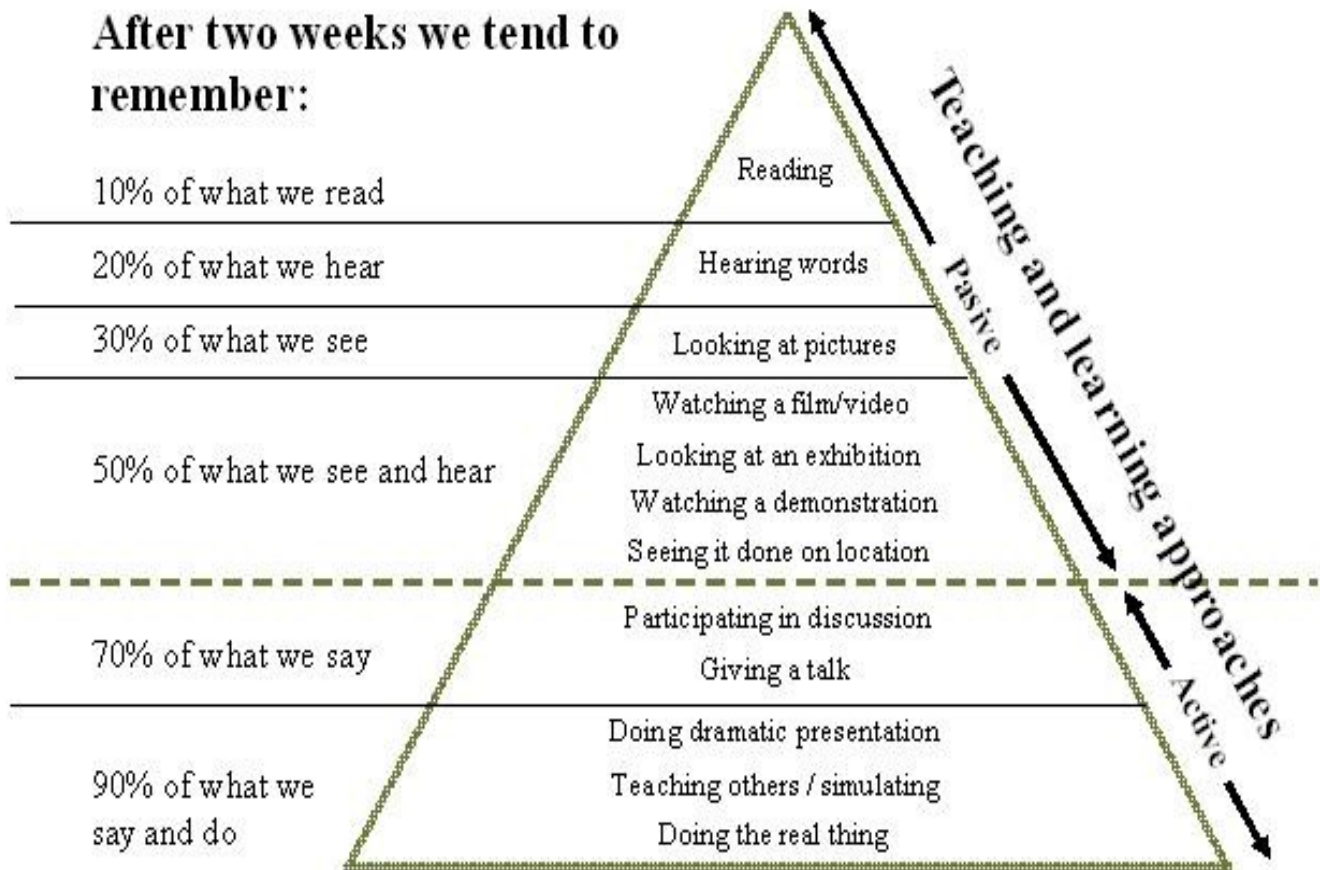
Figur 1: Læringspyramiden (Dale, 1957)