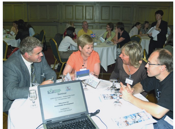
Task Group 8 driver seminar om Utdanning for Bærekraftig Utvikling med undervisere i "Civic Social & Political Education" (CSPE) i Athlone, Irland 2007.

I vår leting etter en bærekraftig utvikling blir det nødvendig på nytt å formulere vår stilling i forhold til miljøet. Vi har ikke råd til å fortsette med å gjenta våre feil. Vi må lete etter bedre løsninger med utgangspunkt i verdiene til Utdanning for Bærekraftig Utvikling og omformende fremgangsmåter rundt læring kan hjelpe oss i denne prosessen.