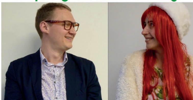
Gareth Suggernaut 'green growth'