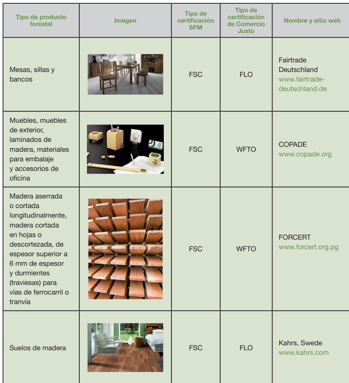
Tabla 3: Ejemplo de productos de madera obtenidos tanto de fuentes gestionadas sosteniblemente como de Comercio Justo

Para ver estudios de casos detallados sobre fuentes sostenibles y de Comercio Justo consultar la guía de Madera Justa en Acción para comunidades forestales 3 .