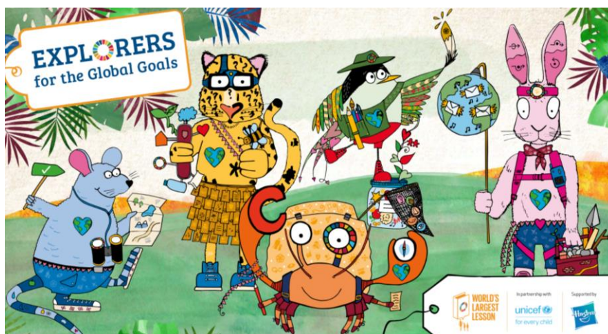
Együttérző Egon, Problémamegoldó Pongrác, Kíváncsi Kázmér, Kreatív Kitti és Hírmondó Hilda, az óravázlat főszereplői

A tanórán és tanórán kívül is használható feladatgyűjtemény 5 kedves állatfigurán keresztül magyarázta el a kisiskolásoknak a 17 Globális Célt. A diákoknak egy képzeletbeli kalandtúrán kellett részt venniük; a különféle próbatételek, feladatok megoldásában az extrém tulajdonságokkal felruházott állatfigurák segítettek nekik. Az eredetileg angol nyelven íródott feladatgyűjtemény magyarra fordítás után került fel a honlapra.