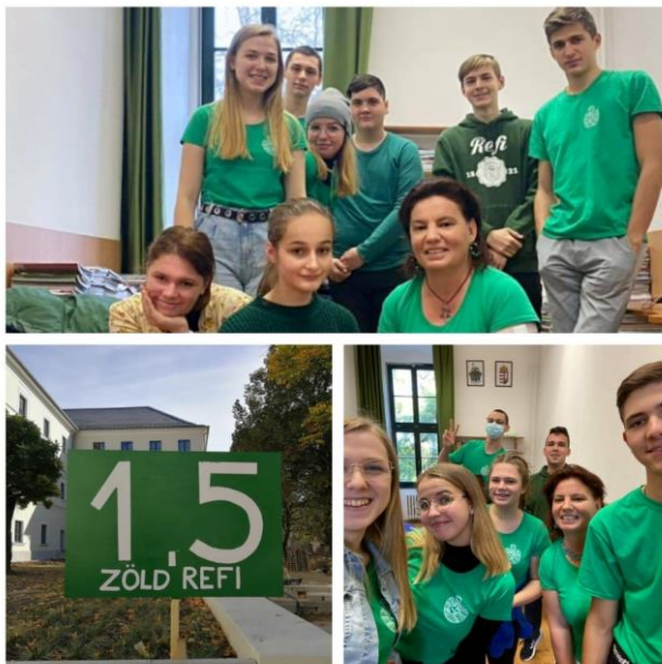
A Sárospataki Református Kollégium Gimnáziumának diákjai

A diákok szervezésében az egész iskola részt vett egy 1,5km-s városi felvonuláson a 1,5 fokos felmelegedés megtartása érdekében az ENSZ Glasgow-i klímakonferencia jegyében.