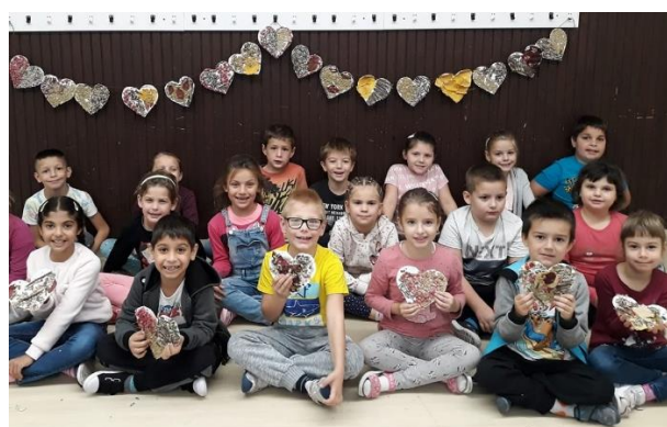
A Pápai Weöres Sándor Általános Iskola diákjai, a Világ Legnagyobb Tanóráján elkészült alkotásaikkal