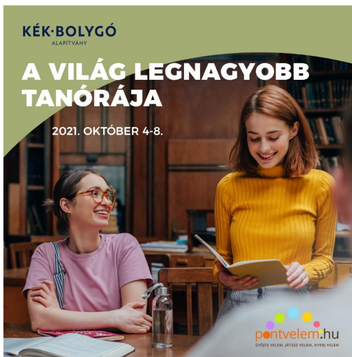
A Kék Bolygó Alapítvány népszerűsítő grafikája