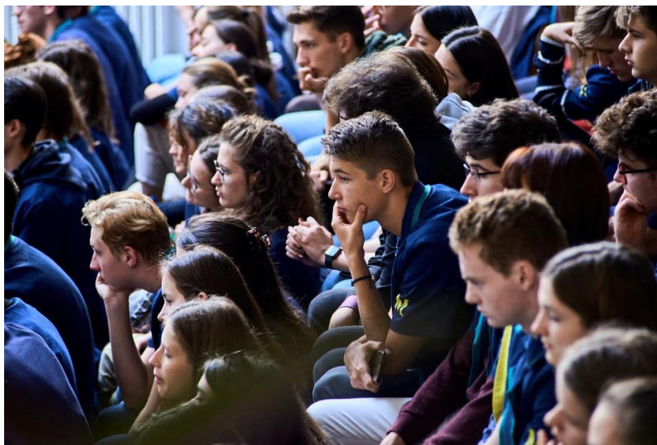
A klímavédelmi tanóra Budakeszin, a Prohászka Ottokár Katolikus Gimnáziumban zajlott.

A nyitó tanórát Áder János köztársasági elnök tartotta, október 4-én, 11 órakor. Az Origó hírportálon és a Világ Legnagyobb Tanórája honlapon élőben követhették az érdeklődők a tanórát, illetve az alábbi videóban felvételről visszanezhető volt: https://videa.hu/videoek/fenntarthatosagi-temahet/nagyvilag/elnoke-tanora-vlt-2021.-fenntarthatosag-kornyezetvedelem-koztarsasagi-elnoke-mMwRC9Ly6rVBdwff?start=0 A rendezvénysorozat végére 43 000 megtekintése volt a videa csatornán.