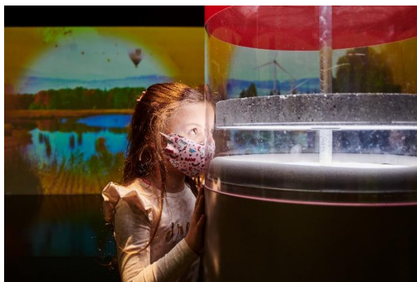
Planet Budapest 2021 ifjúsági élményprogramja

A pályázat az utazás, a szállás (ha szükséges) és a program minden egyéb költségét fedezte. A nyertes diákok lehetőséget kaptak, hogy A Jövő Hősei (Heroes of the Future) élmény és kalandpályán végig menjenek, illetve a Te bolygód (Your Planet) interaktív kiállítást és élményközpontot megnézzék. Az eseménysorozaton 130 iskolai csoport 3.100 diákja vett részt.