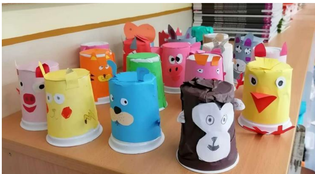
A Nagykovácsi Általános Iskola 3. b osztály tanulóinak alkotásai

Projektükben egy héten keresztül minimalizálták a kommunális hulladékba kidobott szemetüket.