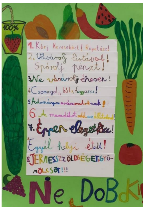
A Gyertyánffy István Gyakorló Általános Iskola diákjainak plakátja

A csapat élelmiszerpazarlási kampányt szervezett. Céljuk az volt, hogy az iskola tanulói ne dobjanak ki ételt a szemetesbe, csak annyit ebédeljenek az iskolai menzán, amennyit meg is esznek.