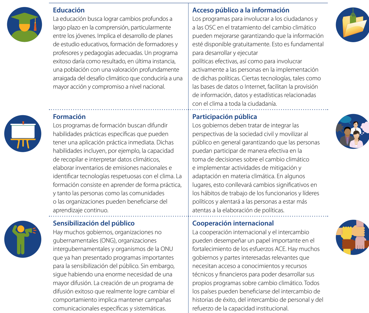
Tabla 2 • Características de cada elemento ACE