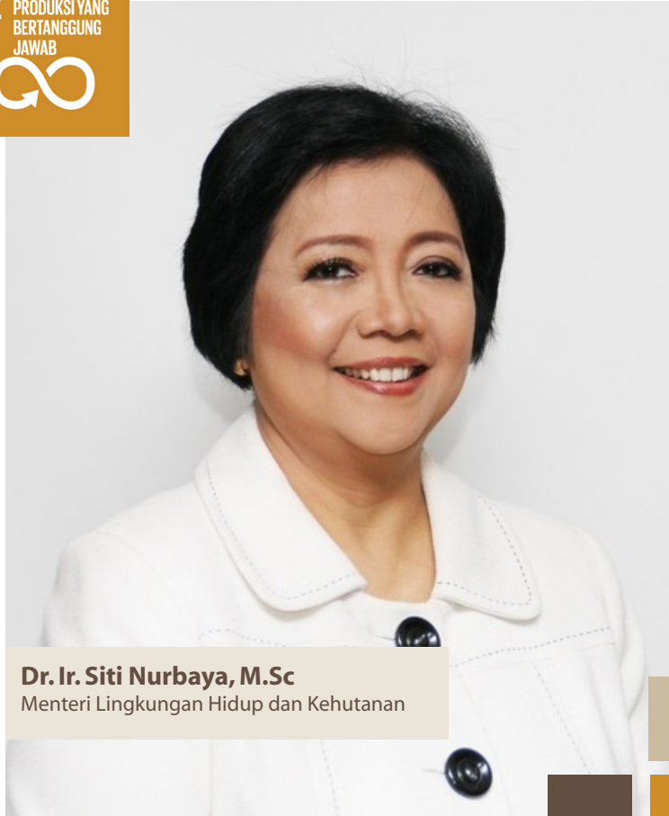
Dr. Ir. Siti Nurbaya, M.Sc Menteri Lingkungan Hidup dan Kehutanan