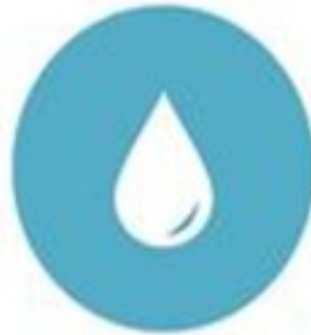
Gestão Sustentável e Integrada de Águas Urbanas