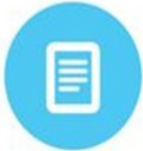
Agenda 21 Local