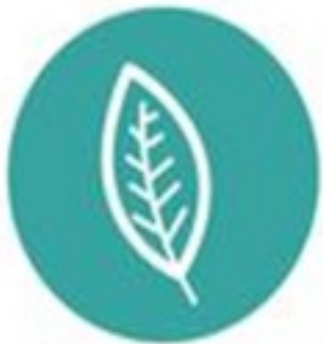
Gestão da Biodiversidade Urbana