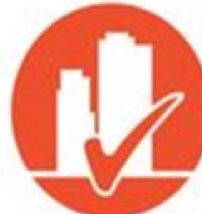
Cidades Resilientes e de Baixo Carbono