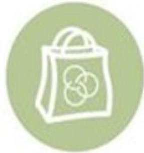
Compras Públicas Sustentáveis