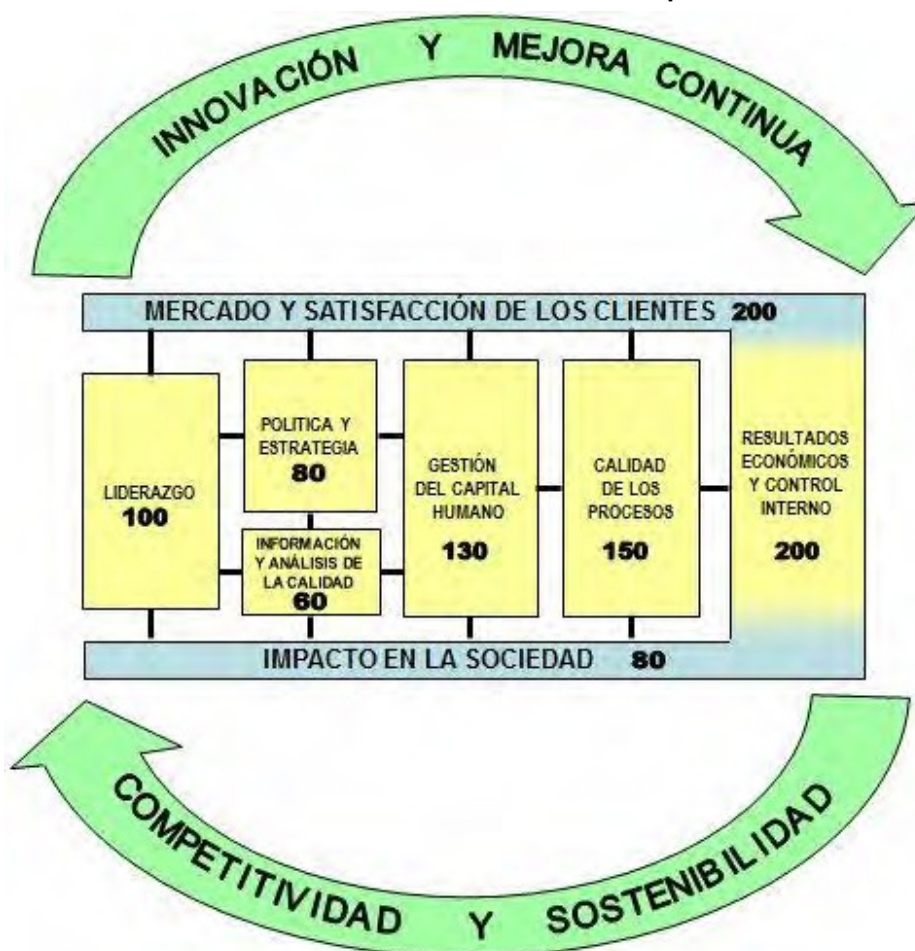
Fig. 1. Modelo de Excelencia del Premio Nacional de Calidad de la República de Cuba

Los criterios que conforman dicho Modelo: